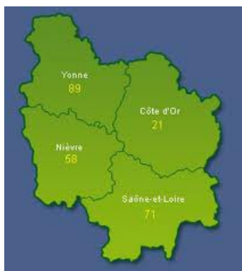
Département Yonne se nachází na severozápadě Burgundska