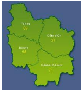
Le département de l'Yonne se situe au nord ouest de la Bourgogne