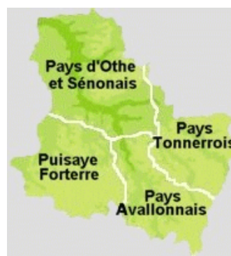
Département Yonne se dále dělí na 4 části.

Francie se územně dělí na regiony, které jsou dále rozděleny do departementů a tyto departementy dále do arrondissementů, do kterých se nevolí žádné zastupitelstvo a mají pouze smysl pro zařazení a administraci. Poslední článkem tvoří obce, kterých je ve Francii 36 700. Obce jsou samosprávné s volenou radou. Tonnerre je tedy nejen obcí, ale je i součástí územních celků - Pays Tonnerrois, departementu Yonne a regionu Burgundsko.