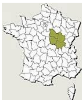
Tonnerre najdeme v Burgundsku

Tonnerre je malé francouzské městečko s 5 492 obyvateli, které se nachází v Burgundsku, v départementu Yonne.