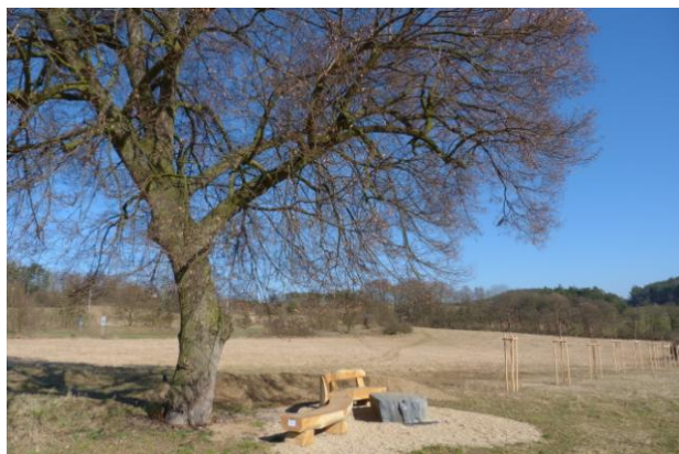
Obrázek 3: Čím – posezení pod lípou