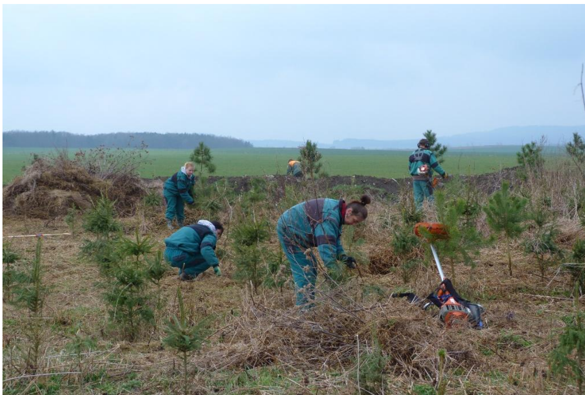
Obrázek 6: Pracující četa

Sejcké Lhotě, Mokrsku, Prostřední Lhotě a v dalších částech této rozlehlé obce. Starostové i místní obyvatelé jsou doposud s prací naší čety velmi spokojeni, zaměstnanci jsou často mile překvapeni například nabídkou kávy ze strany místních obyvatel. Četa bude v našem území v rámci projektu působit do února roku 2015 a dále bychom chtěli dobré zkušenosti zúročit při přípravě tzv. sociálního komunálního podniku, který by dlouhodobě zajišťoval pracovní uplatnění pro osoby, které obtížně hledají zaměstnání. V rámci projektu nabízíme také odborné sociální poradenství (řešení dluhů, psychologické poradenství, pomoc s vyhledáním zaměstnání apod.). Pořádáme pravidelné semináře pro osoby hledající zaměstnání, v rámci kterých například nacvičujeme pracovní pohovor, vyhledávání zaměstnání přes specializované aplikace apod. Projekt je podpořen z Evropského sociálního fondu prostřednictvím Operačního programu Lidské zdroje a zaměstnanost a Státního rozpočtu ČR.