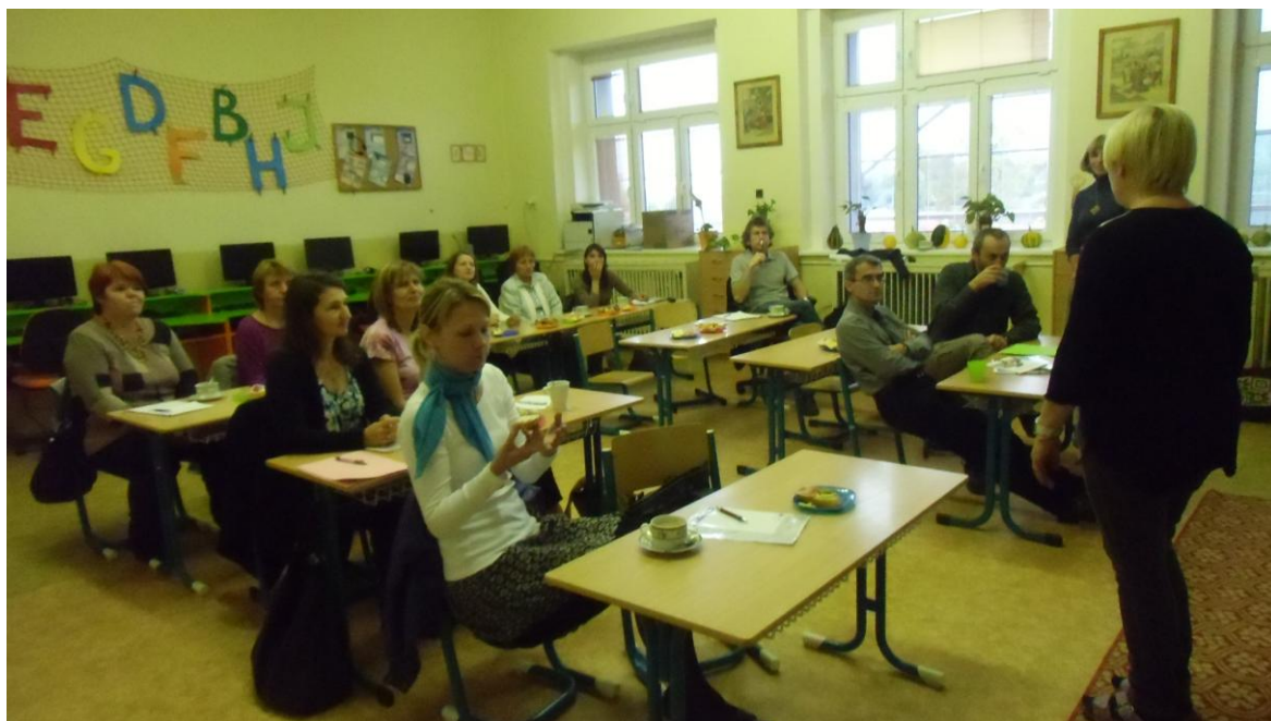
Obrázek 5: Seminář z projektu Cesty venkova – Komunitní škola

6) Inspirativní ukázky práce s dětmi a mládeží ve volnočasových aktivitách s důrazem na ty, které využívají místní krajinu a místní specifika.