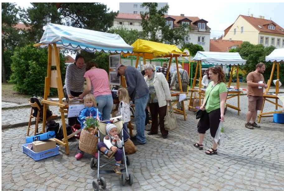
Obrázek 1 Regionální veletrh cestovního ruchu v Dobříši

O aktivitách projektu bylo v průběhu celého roku informováno prostřednictvím místních periodik (Dobříšské listy, Novoknínský zpravodaj, Hradištský zpravodaj) a na webech obcí. Výstupy projektu byly shrnuty na závěrečné konferenci pořádané v Chotilsku.