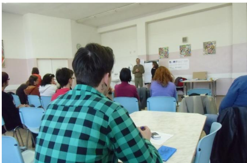
Obrázek 4 Setkání pracovní skupiny v Novém Kníně

Celkem bylo zorganizováno 11 workshopů s problematikou sociálních a návazných služeb a udržitelnosti procesu plánování . 6 poskytovatelů sociálních a návazných služeb se také zapojilo do odborných konzultací.