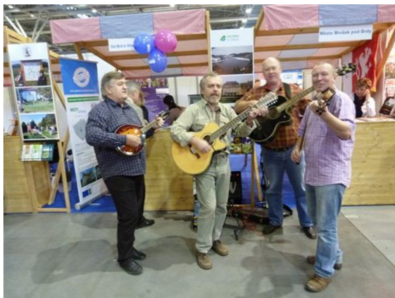
Obrázek 3 Regiontour 2012