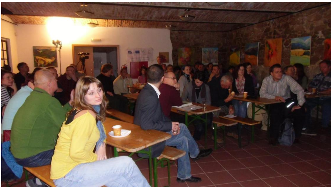
Obrázek 6 Setkání akčních skupin zapojených do programu Proměny míst