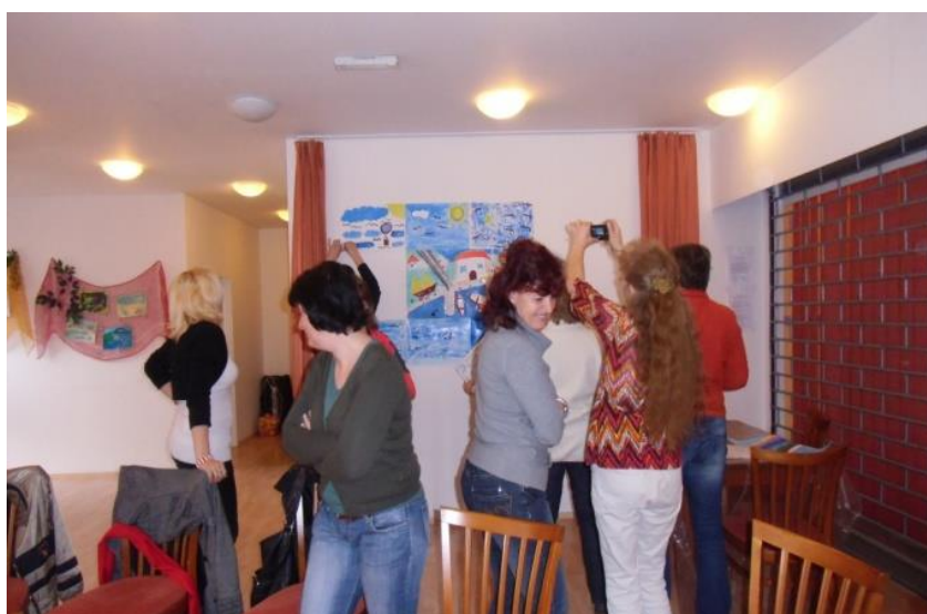
Obrázek 5 workshop pro poskytovatele sociálních služeb ve Štěchovicích