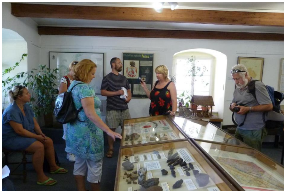
Obrázek 2 Návštěva novinářů v novokněžském muzeu v rámci press tripu