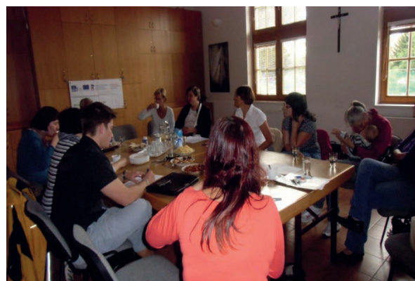
Setkání pracovní skupiny Dobříš