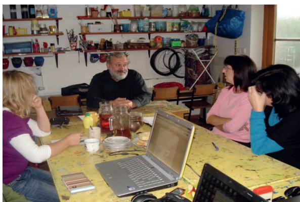
Konzultace v RC Dobříšek

Celkem bylo zorganizováno 11 workshopů s problematikou sociálních a návazných služeb a udržitelnosti procesu plánování. 6 poskytovatelů sociálních a návazných služeb se také zapojilo do odborných konzultací.