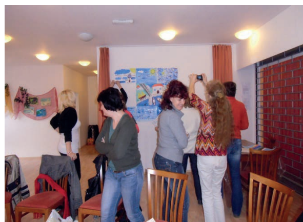
Workshop týmové spolupráce ve Štěchovicích