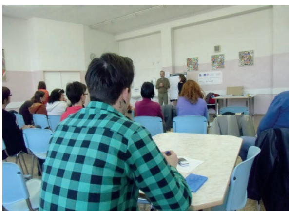
Setkání pracovní skupiny v obci Nový Knín